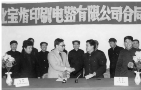
宝临公司合资签协议式

外向经济多点开花。 新中国成立以来,临安实现了从封闭半封闭经济向开放型经济的历史性转变。特别是世纪初我国加入 WTO 以后,外贸市场进一步扩展,全区贸易出口额开始迅速扩大。1978 年,全区外贸出口仅为 0.11 亿元,1988 年首次突破 1 亿元,1997 年突破 10 亿元,2018 年出口总额达到了 119.11 亿元。全区告别了过去初级、低档附加值产品为主结构,已经形成了以电线电缆、节能灯、医药化工、机电产品、装饰纸等为主的多元结构。跨境电商从无到有,2018 年底,全区共有跨境上线企业 370 余家,占外贸企业的 50% 以上。其中跨境电商园入驻企业 145 家,实现出口 2.41 亿美元,占全区跨境出口的 73.9%。2020 年,全区实现进出口总额 179.91 亿元,比上年增长 4.6%,其中出口 130.18 亿元,增长 4.5%。