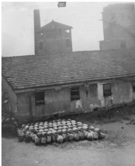
建国初期於潜酒厂酿酒厂房

回望临安工业经济发展的光辉历程正是祖国工业化进程历史长河中的一个缩影。建国初期,临安的工业基础十分薄弱,个体手工业小作坊生产一直占据主导地位,比较像样的企业只有刚建立的临安人民印刷厂、於潜酒厂、粮油厂等一些小微企业。